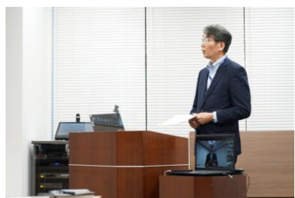
宮崎技術本部長の講評