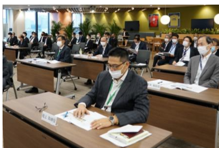
感染対策を実施して開催しました